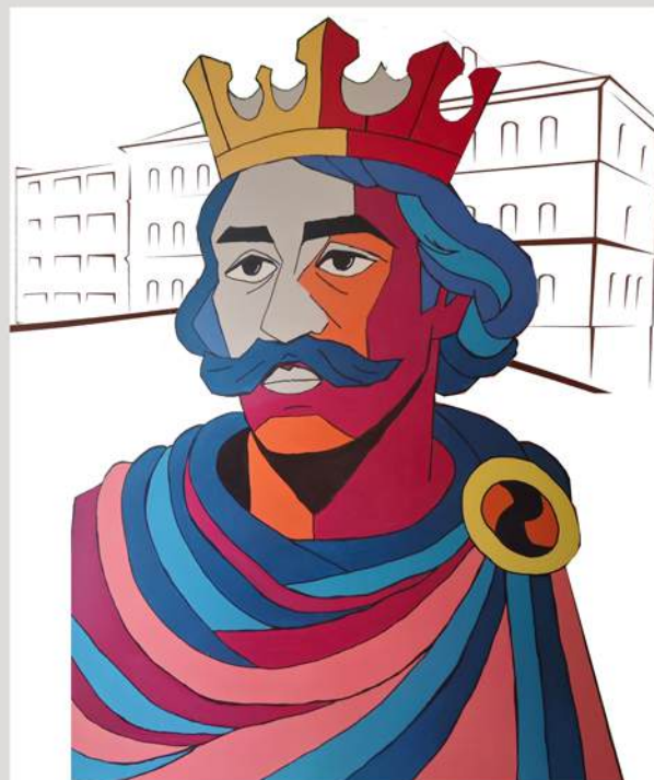
LICEUM OGÓLNOKSZTAŁCĄCE Z ODDZIAŁAMI DWUJĘZYCZNYMI IM. BOLESŁAWA CHROBREGO W GRYFICACH